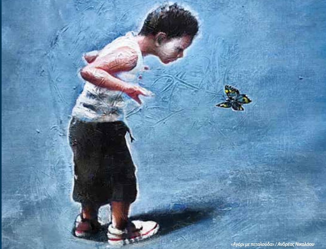
«Αγόρι με πεταλούδα» / Ανδρέας Νικολάου